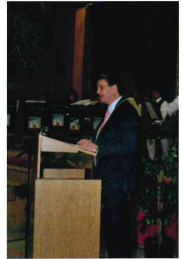
Bilder Neujahrsempfang