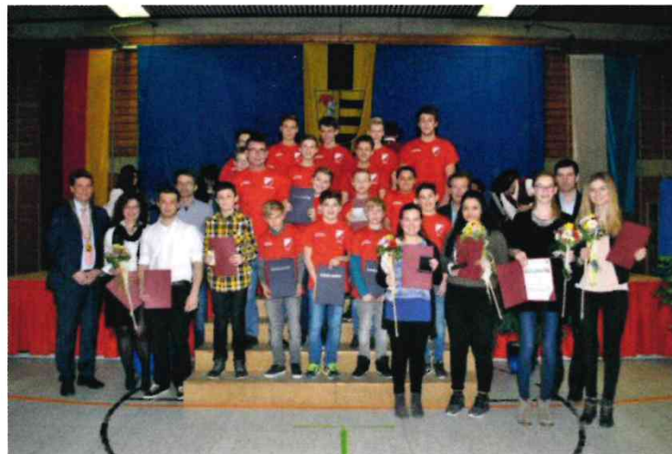
Bilder Neujahrsempfang

Die U13-Junioren-Mannschaften (Groß- und Kleinfeld) des SV Ettenkofen als Mannschaft